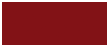
3R3 Červená - Barcelona*