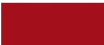
3P0 Červená - ohnivá