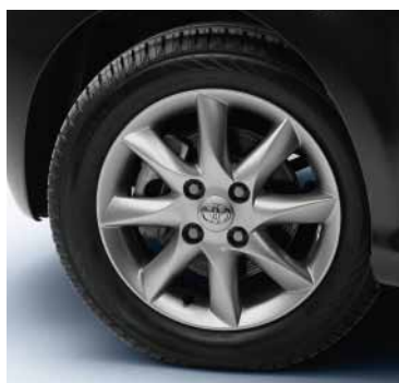
14" litá kola Antibes