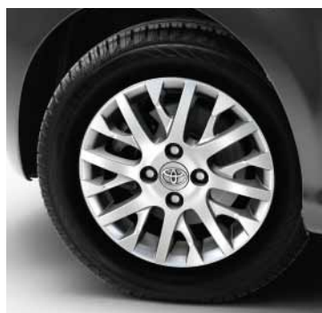
14" litá kola Olea