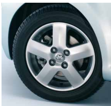
14" litá kola Tamarin