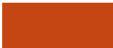
4R8 Oranžová - Tabasco*